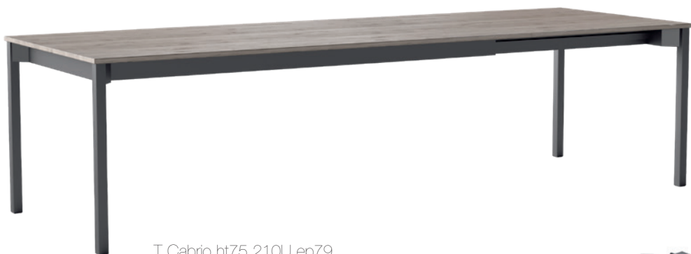
T Cabrio ht75 210U ep79 ...