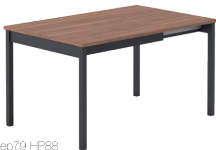
T Cabrio ht75 99U ep79 HP88