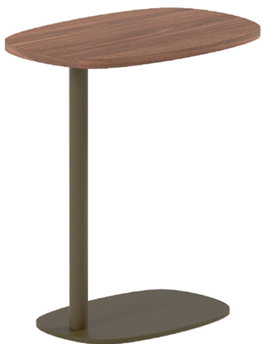
T Cup ht55 5033C epa83 HP88