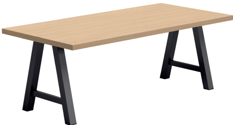
T Querido HPL ht75 ... ep79 HP81

EPOXY (ep../epa..) - \nabla 70x70 mm - HT75/90